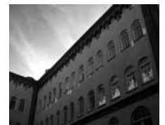
GRØNS VAREPAKHUS HOLMENS KANAL 7 1060 KØBENHAVN K