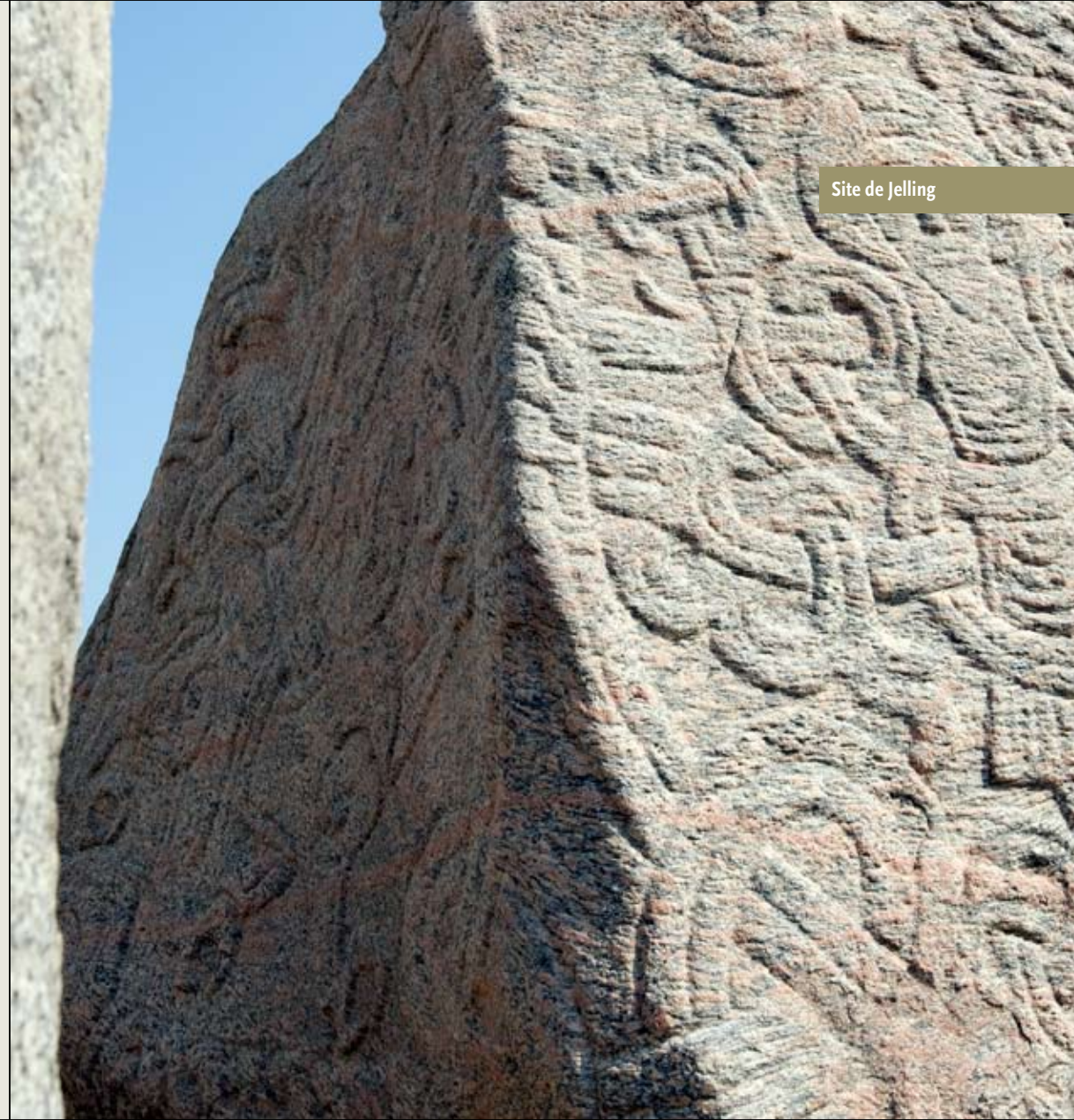
Site de Jelling

...une répartition plus équitable entre les sites naturels et culturels