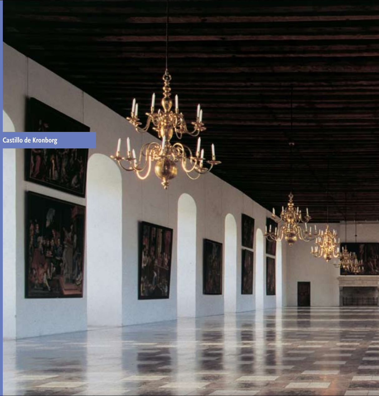
Castillo de Kronborg