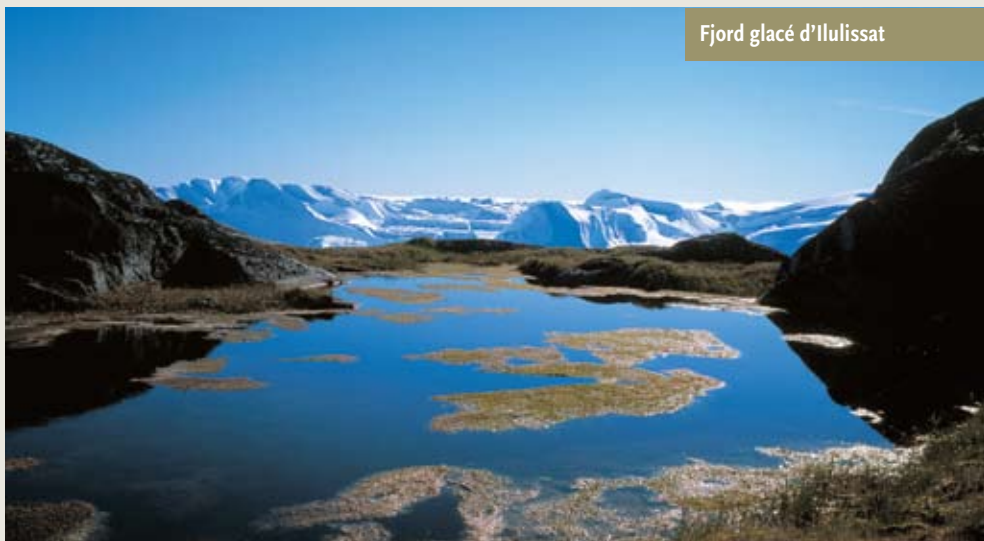
Fjord glacé d'Ilulissat

Les changements climatiques dans les espaces arctiques donnent lieu à la montée des océans, pouvant causer de graves pertes culturelles ailleurs dans le monde. Ils produisent également des conditions météorologiques extrêmes qui accélèrent l'érosion et la disparition du Patrimoine mondial.