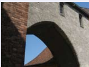
Catedral de Roskilde

...divulgar de manera organizada y específica las experiencias obtenidas en la implicación de autoridades locales y de jóvenes y niños en los sitios declarados patrimonio mundial, por ejemplo en el marco de la Red del Plan de Escuelas Asociadas de la UNESCO