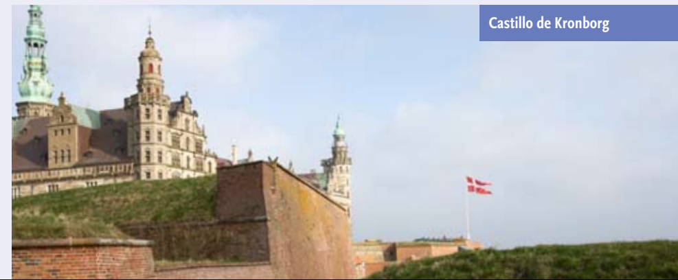
Castillo de Kronborg