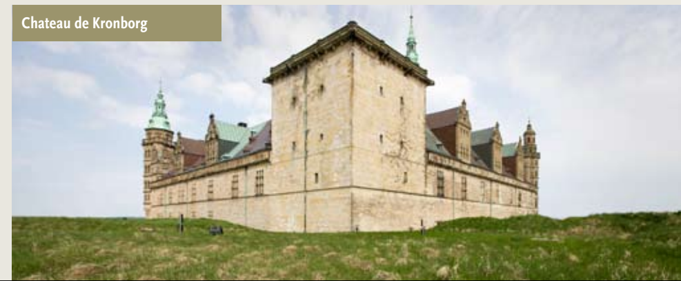
Chateau de Kronborg