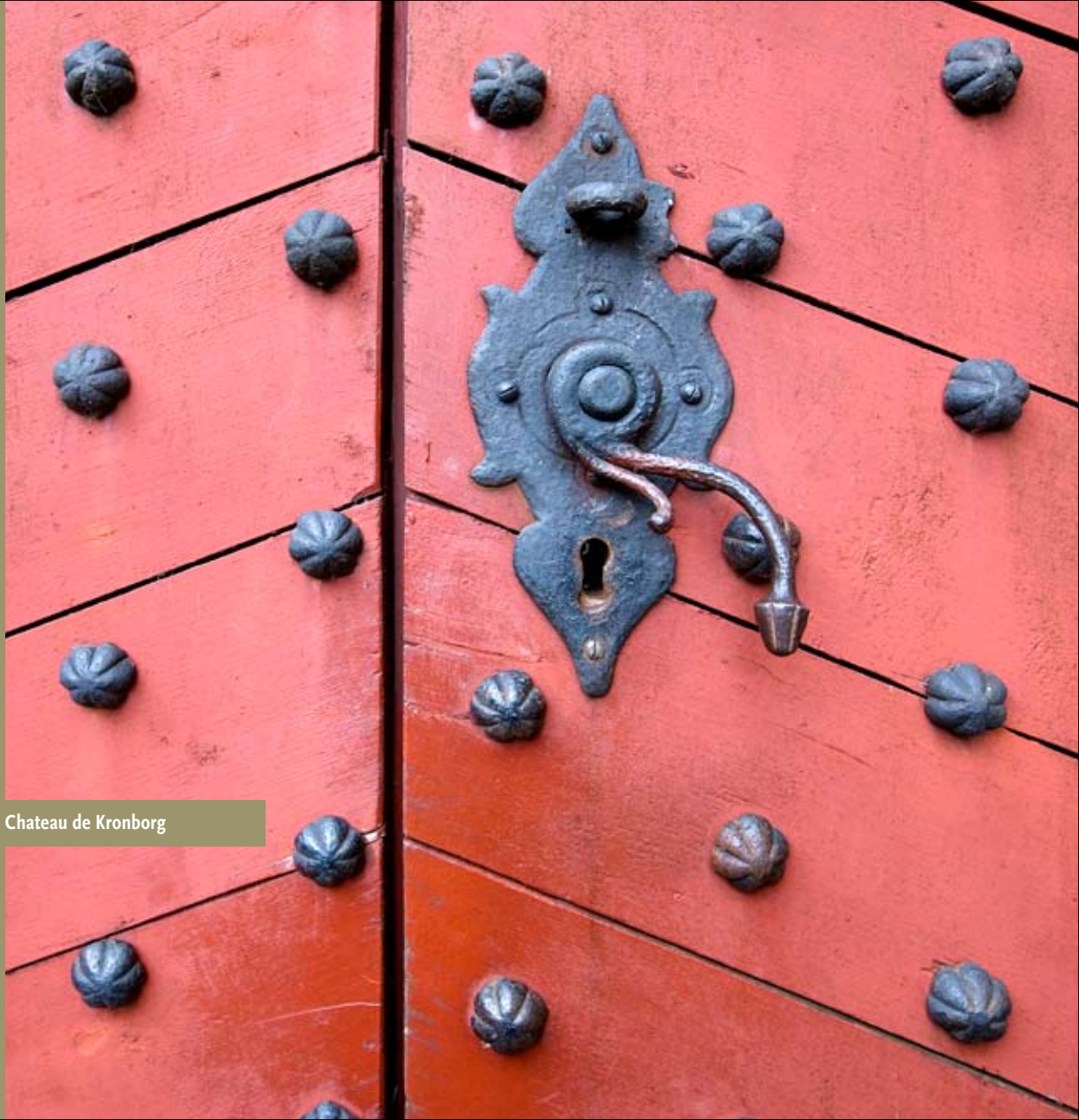
Chateau de Kronborg