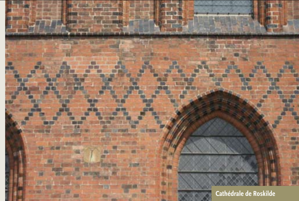
Cathédrale de Roskilde