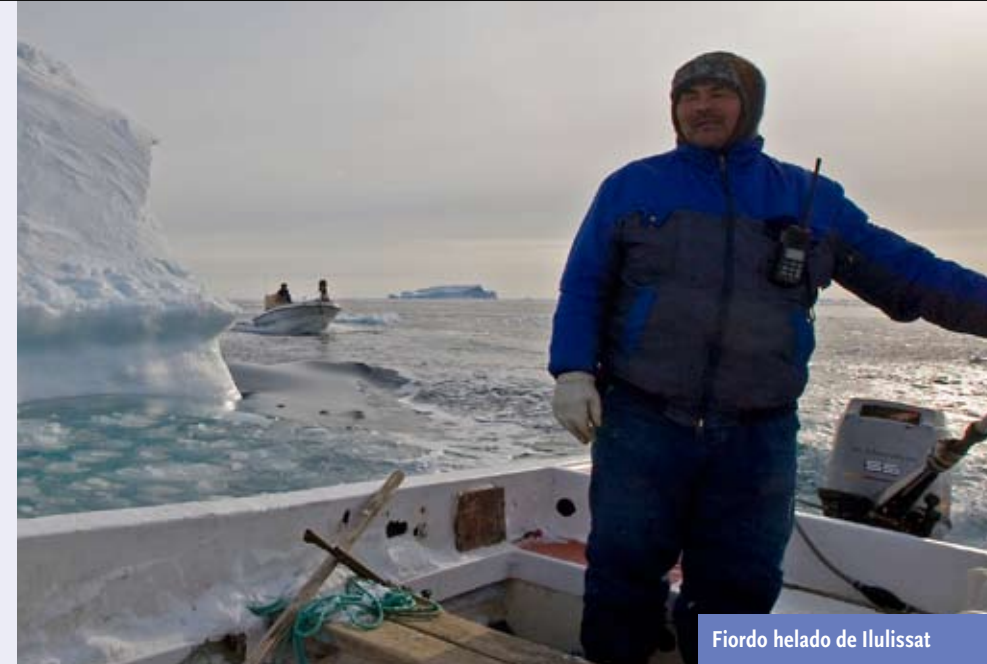
Fiordo helado de Ilulissat