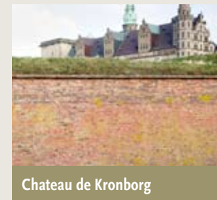
Chateau de Kronborg

Le Danemark conçoit la Convention du Patrimoine mondial dans le cadre des autres activités de l'UNESCO et des Nations Unies et souhaite inscrire les sites du Patrimoine mondial dans les sociétés environnantes. Le Patrimoine mondial peut contribuer à encourager un développement durable, dans le respect des projets de gestion et des programmes de tourisme viables.