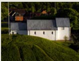
Site de Jelling

...une communication organisée et pointue de l'expérience acquise à travers l'implication des autorités locales, des enfants et des jeunes des sites du Patrimoine mondial, entre autres dans le cadre du réSEAU (Réseau du système d'écoles associées de l'UNESCO)