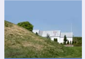
Vestigios de Jelling

Dinamarca entiende la Convención en tanto que elemento vinculado a las demás actividades de la UNESCO y de la ONU y desea que los sitios declarados Patrimonio Mundial sean parte activa de la sociedad en la que se encuentran. El Patrimonio Mundial puede contribuir a promover un desarrollo sostenible siempre que se observen los planes de gestión y los programas de turismo sostenible existentes.