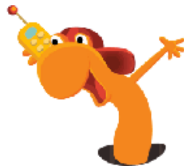
På hjemmesiden for Historiens Dag viser maskotten Regner Regnorm vej til de mange arrangementer.

Meningen er derefter, at familierne sammen laver en liste over arrangementer, de ønsker at deltage i – og så er de klar til skattejagten søndag 22. maj! Ved alle