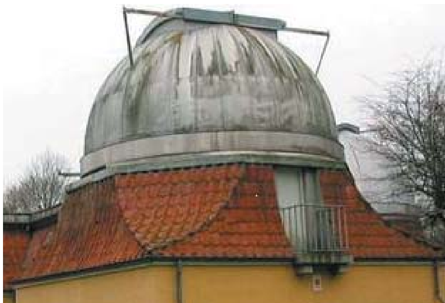
Ole Rømer Observatoriet i Marselisborg ved Århus er kendt for sin zinkbeklædte kuppel. Nu er hele anlæget indstillet til fredning.

nærmest er opbygget som en mansard. Det har naturligvis været vigtigt, at taget var så lavt som muligt for at få bedst muligt udsyn. Umiddelbart nord for observatoriet ligger direktørboligen, som har bevaret helt centrale elementer som snedkerdetaljer og den overordnede rumstruktur. I hall'en, der er relativt mørkt, bliver det centrale relief af Ole Rømer meget elegant belyst af et ovenlys. Bygningen bruges i dag som gæsteboliger for undervisere på universitetet.