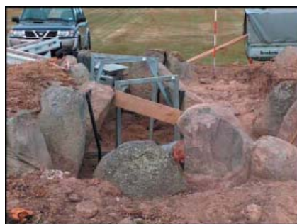
Jættestuen på Svinø bliver nu restaureret.

Arbejdet begyndte med, at anlægget blev ryddet for vegetation. Derefter løftede