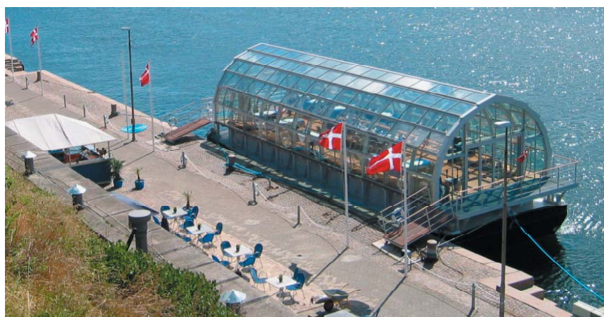
Denne glaspram, der ligger forankret på Middelgrundsfortet, er ikke et skib, mener Naturklagenævnet.

Kulturarvsstyrelsen præciserede, at det er rigtigt, at køretøjer på fortet ikke kræver tilladelse i forhold til fortets status som fredet bygning. Men da fortet samtidig