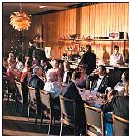
Mange fredede bygninger optræder i den populære tv-serie. Også steder, som er i gang med at blive fredede, f.eks. Langeliniepavillonen i København.

sit fatale møde med Viggo Valentin, er Radiohuset på Rosenørns Allé på Frederiksberg. Det blev opført som et storslået funktionalistisk byggeri i slutningen af 1930'erne af Vilhelm Lauritzen og har frem til dag været ramme om Statsradiofonien. Man har benyttet mange af Radiohusets velbevarede og fornemt udstyrede rum i "Krøniken", bl.a. det store trapperum og koncertsalen, hvor Margrethe synger til julekoncerten.