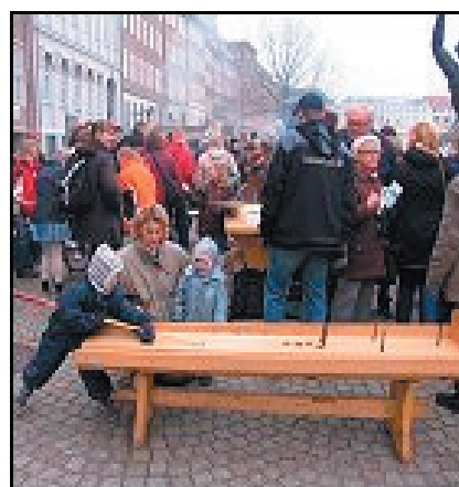
Computerskærme og tastaturer var for en enkelt dag erstattet med et godt gammelt brædspil af træ.

Alene i København anslår Kulturarvsstyrelsen, at omkring 6-8000 mennesker besøgte det gamle marked på Gl. Strand, og lige så mange kunne man finde rundt omkring i byen på historisk skattejagt. Åbningsarrangementerne i Århus, Odense og Aalborg havde stor tilstrømning med 2-3000 gæster, mens man i Esbjerg