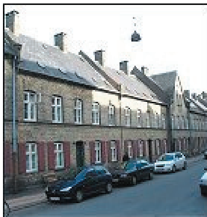
Olfert Fischersgade, fortrinsvis placeret parvis om et gårdrum.

De syv "Grå Stokke" ligger lige bag den gule del af Nyboder. De er opført omkring år 1900 efter, at man havde revet nogle af de ældste bygninger ned. De Grå Stokke ligger i gaderne: Haregade, Gernersgade, Rævegade, Sankt Pauls Gade og