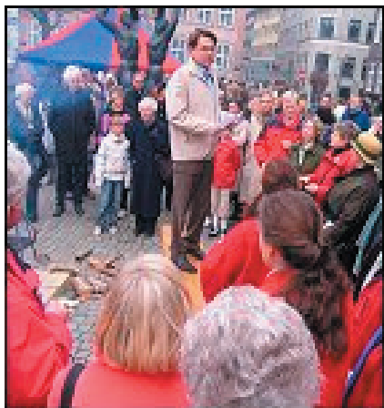
Kulturminister Brian Mikkelsen åbnede Historiens Dag på Gl. Strand i København.

Der var børn overalt på Historiens Dag 2006. Hele dagen - 30. april - legede og lyttede de sammen med deres voksne.