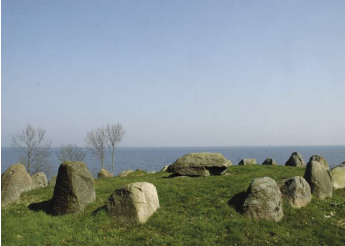
Baronens Høj i Nørreskoven på Als

Desuden kan mølleanlæg, dæmninger, bro- og vejanlæg, helligkilder, kanaler, sten og træer, hvortil der er knyttet folketro, historisk overlevering eller kulturhistorisk tradition samt krigergrave og mindesmærker være omfattet af beskyttelsen.