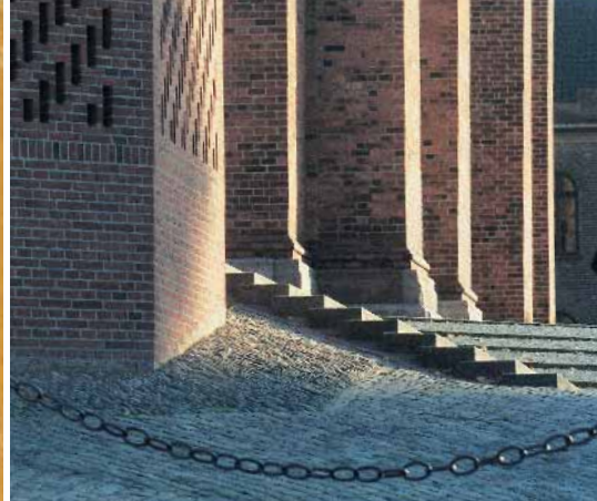
Frederik IX og Dronning Ingrids gravplads

Verdensarvslistens kriterier for autenticitet opfyldes i fuldt mål af domkirken. Reparationer og ændringer i tidens løb har været hensynsfulde over for dette enestående bygningsværk.