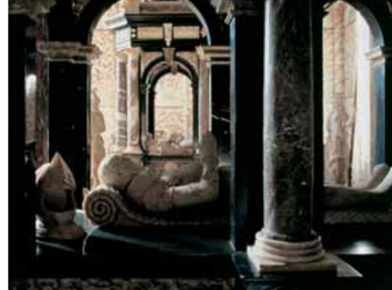
Christian III's gravmæle