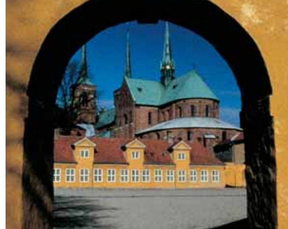
Domkirken set fra palæets gård

Domkirken er næsten udelukkende opført af røde teglsten, et byggemateriale som på denne tid fik fodfæste i landet. Man regner med, at kirken, der blev bygget fra øst mod vest, var færdig omkring år 1280. Siden da er den mest markante ændring i selve kirkens ydre Christian IV's nye spir fra 1635 på de to vesttårne.