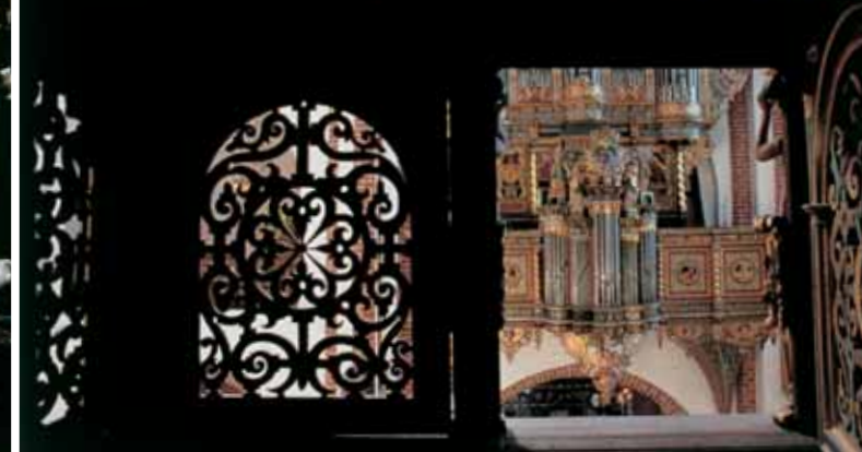
Raphaëlisorglet i hovedskibets sydside