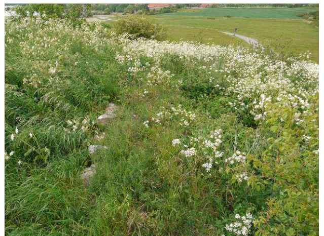
Østre ringmur overgroet og sprængt