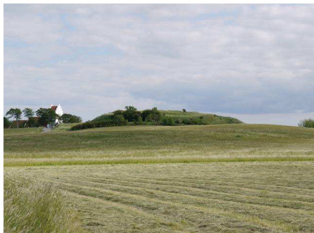
Slotsbanken og kirken set fra ladegården

Der gror flere år gamle træer på og umiddelbart op til ruinens mure og i brolægningerne. Disse skal fjernes