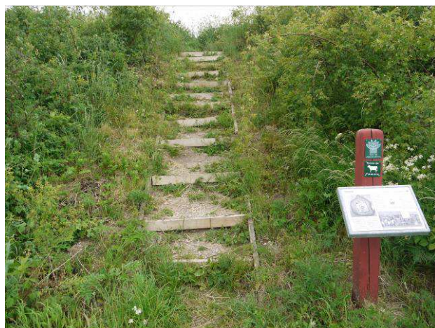
Nedslidt trape til borgpladsen