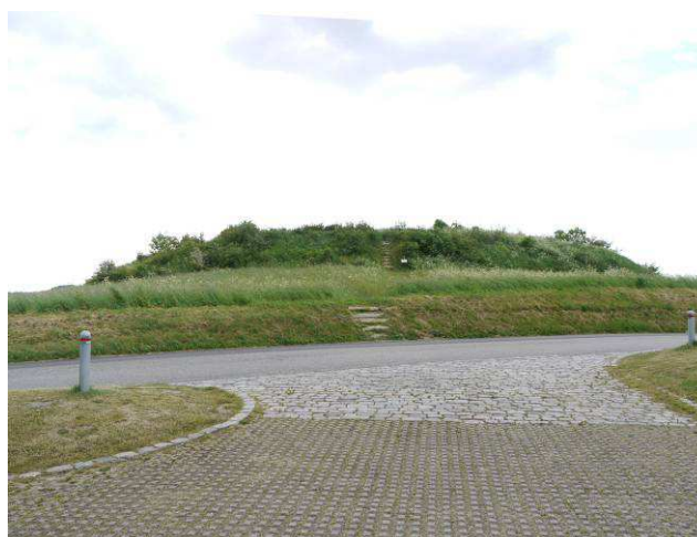
Slotsbanken set fra P-plads