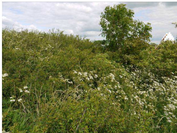
Søndre ringmur helt overgroet af krat