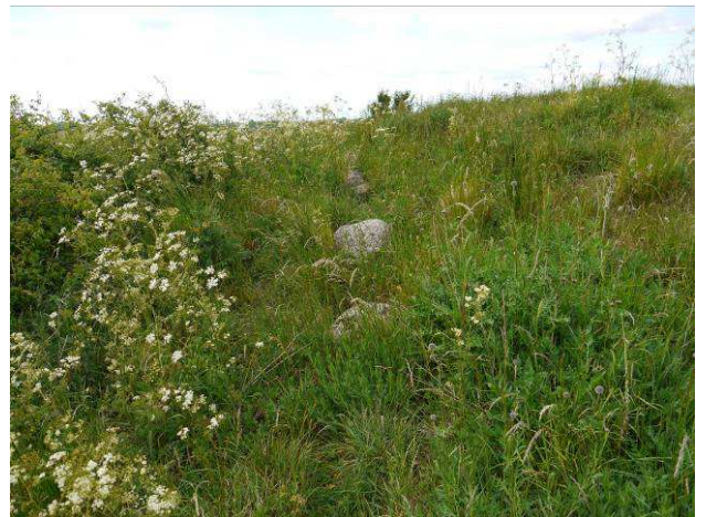
Nordre ringmur sprængt