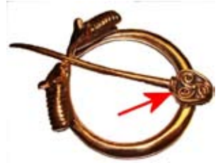
Hoved af ringnål fra Norge eller et af de norske kolonisationsområder i Skotland eller Irland. Til højre ses, hvordan nålen kan have set ud.

Skatten indeholder yderligere et begrænset antal genstande af andre arter, som kun foreligger i få eller enkelte eksemplarer. I en del skattefund fra 900-årenes slutning optræder lange, flettede halskæder af spinkle, ringformede led af tynd tråd. Ramløse-skatten besidder et mindre brudstykke af en sådan kæde og tillige en lille håndfuld løse trådringe fra en eller snarere flere kæder. De samme skattefund har ofte skiveformede smykker med rig filigranornamentik, ofte i kringelform eller i form af sammenflettede dyrefigurer. Ramløse-skatten har kun 2 meget små brudstykker af denne art. Derimod optræder en genstand med langt grovere filigranornamentik, vistnok en del af en relikvieæske til ophængning i en halskæde. Tilsvarende kendes i det vestlige Polen og det østlige Tyskland, og Ramløse-stykket repræsenterer antagelig et importstykke fra dette område. Et stykke af et massivt hængesmykke med påloddede spiraltråde kunne stamme fra de østlige Donau-egne, mens et brudstykke af en ringnål stammer fra Norge eller fra de norske kolonisationsområder i Skotland eller Irland.