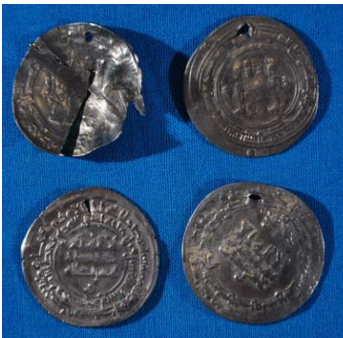
Arabiske sølvmonter genbrugt som hængesmykker.

i vikingetidige forhold. Flere steder heri omtales den såkaldte ”Odins lov”, der siger, at hvad man skjuler i jorden i levende live, skal man nyde i Valhal. Har man derfor nedgravet sin formue før døden, og vel at mærke har ladet den ligge, var man også en holden mand i det hinsidige.