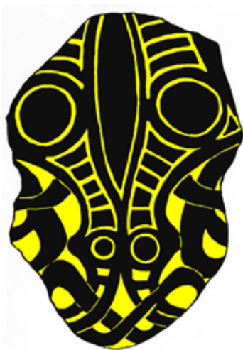
Udtegnede maskefigurer fra skålspænde fra tidlig vikingetid fundet på samme mark som Ramløse-skatten.

Arresø (Tibirke, Ramløse, Huseby, Annisse). Her er det primært detektorfundene, der er vores kilde til disse bosættelser.