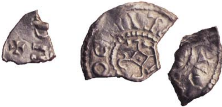
Europæiske mønter (to karolingiske og en engelsk).

indslag af engelske mønter, der måske ikke i så høj grad som tidligere har været importeret som værdimetal. I det mindste er det netop sådanne engelske mønter, der i 1000-årenes begyndelse efterlignes i de ældste danske og svenske udmøntninger - her ses bort fra et par tidligere tilløb til udmøntninger, vistnok i Hedeby, og skattefundene fra 1000-tallet ændrer karakter i forhold til de ældre. Nu er mønterne ofte hele, og skattene består hyppigt kun af mønter uden indslag af andre genstande. Brudsølvet, som i så høj grad præger 900-tallets og det begyndende 1000-tals skattefund, herunder Ramløse-skatten, forsvinder endeligt omkring år 1100. Skandinavien har da fået en egentlig mønt-økonomi.