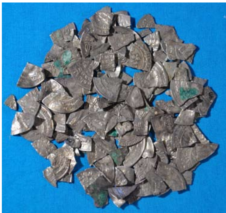
Arabiske sølvmonter klippet i halve og kvarte som betalingsmidler.

I de senere år har man foretaget udgravninger på flere fundsteder for skattefund. Det har herved vist sig, at de ofte har været gravet ned nær samtidige bopladser. Man har derved kunnet holde et vågent øje med nedgravningsstedet, og skulle nogen alligevel forgribe sig på en sådan skat, ville det ikke være vanskeligt at hævde sin ejendomsret dertil.