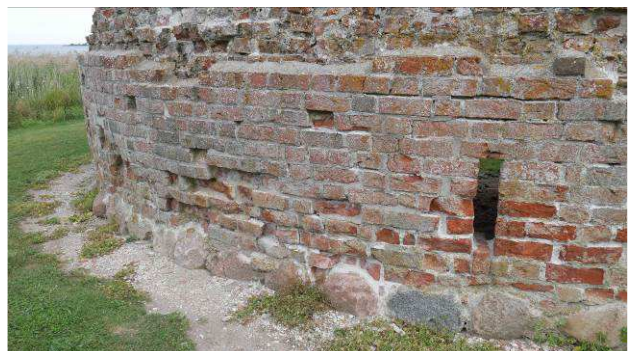
Løst murværk i udvendig facade på tårnet