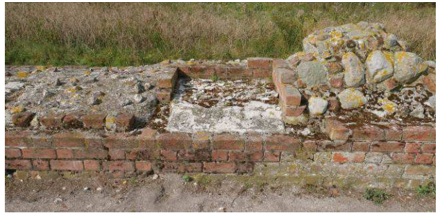
Skydeniche i vestre flankemur med skadet offerlag

Udgiften til årlig pleje anslås til 20.000 Bevoksningen på volden fjernes og den udlægges i græs 50.000