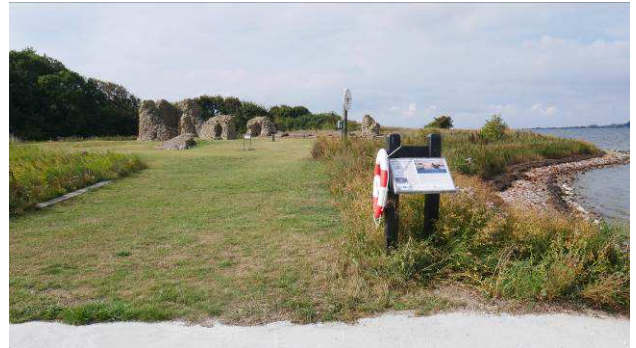
Engelsborg set fra anløbsstedet

Direkte adgang fra stranden. Postbåden og turbåde i Nakskov Fjord lægget til ved den private bro hvor der er opført handicapadgang fra bådene til broen.