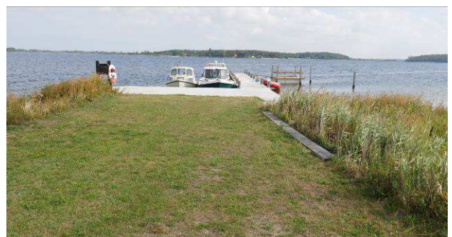
Anløbssted på Slotø