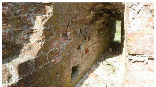
Løst murværk i skydeskår i tårnet