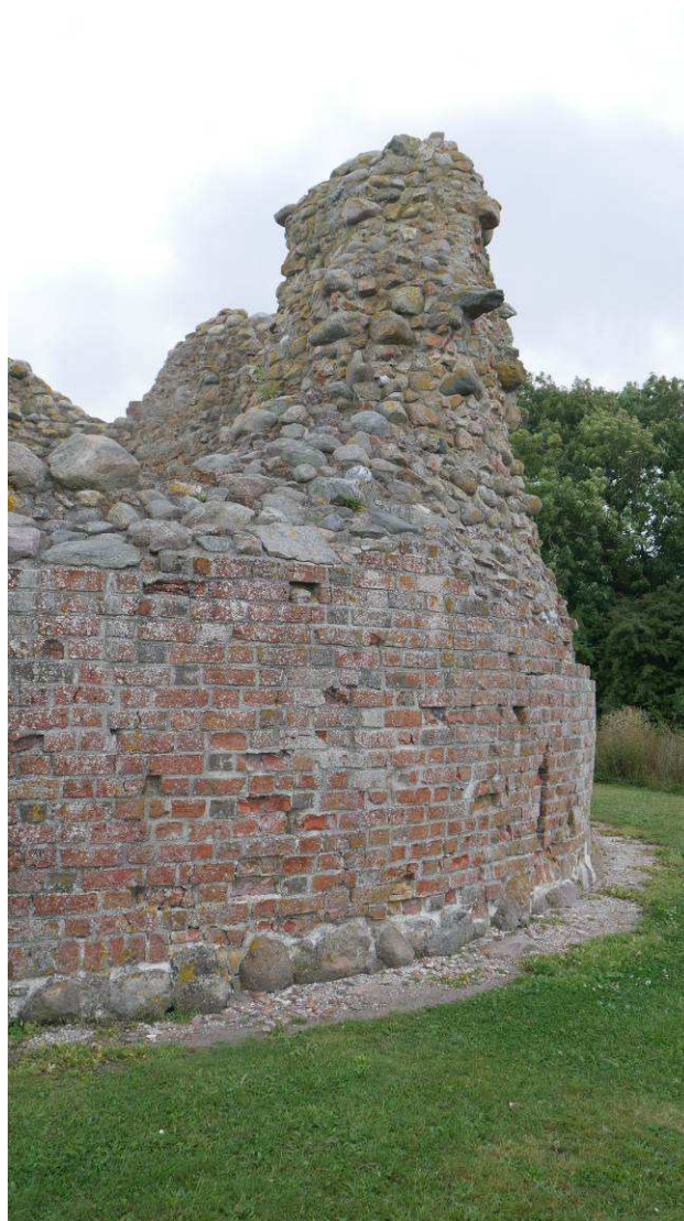
Tårnets vestlige del