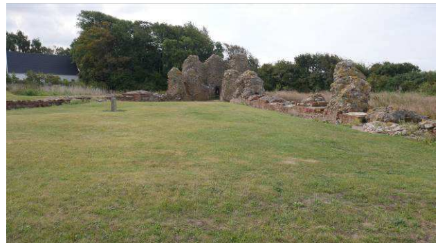
Værftsarealet mellem flankemurene