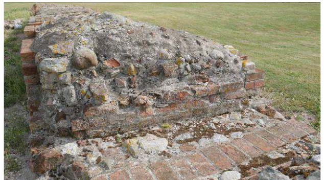
Løst murværk i østre flankemur