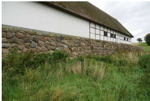
Ladegårdsbankens stensætning mod øst