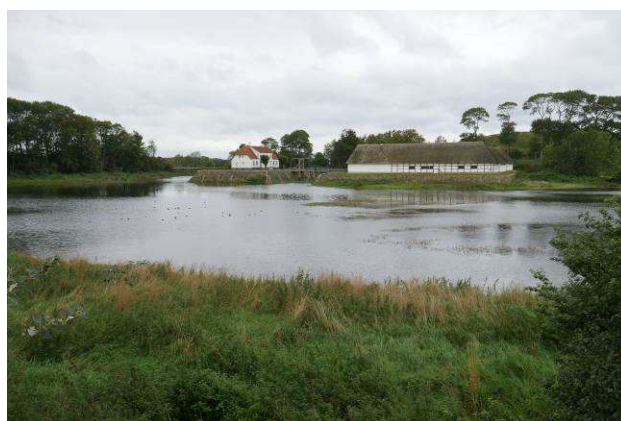
Søbygård set fra øst