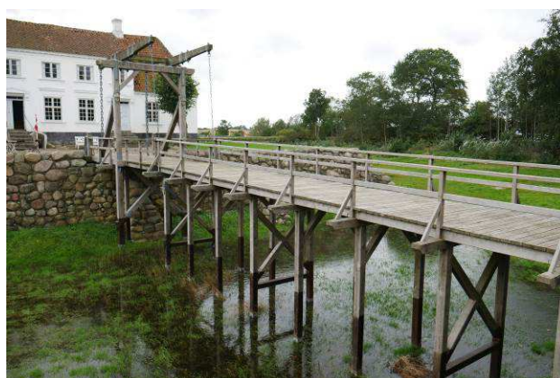
Vindebro mellem hoved- og ladegårdsbanken