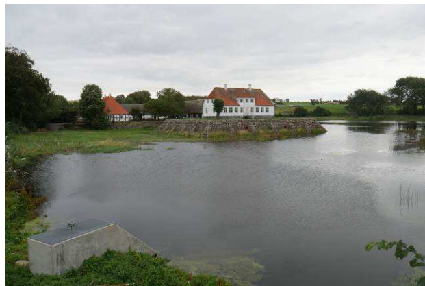
Søbygård set fra syd

Adgang fra P-plads af offentlig vej, ca. 150 meter.