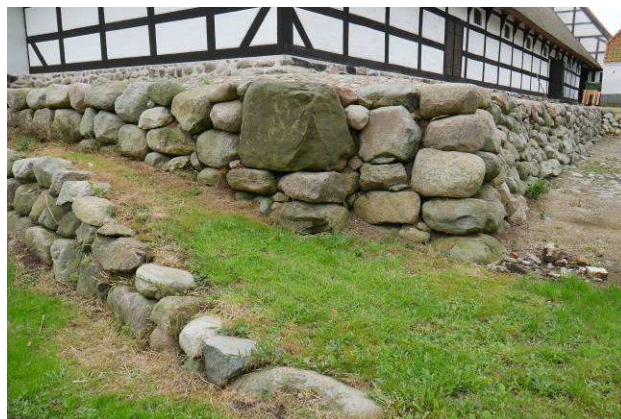
Ladegårdsbankens nordvestre stensatte hjørne