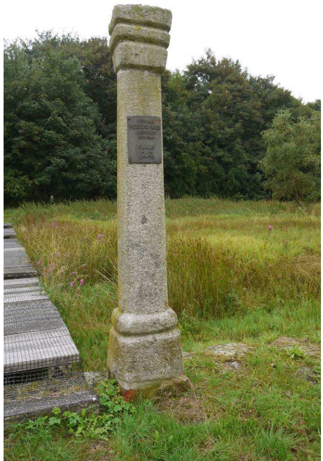
Tilbageflyttet søjle ved indgangen til slottet