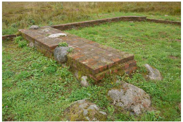
Østlige rums skillevæg

Ny bro 250.000 Græstørvmarkering 150.000