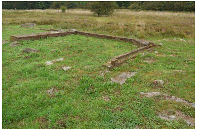
Løst murværk i søndre indermur