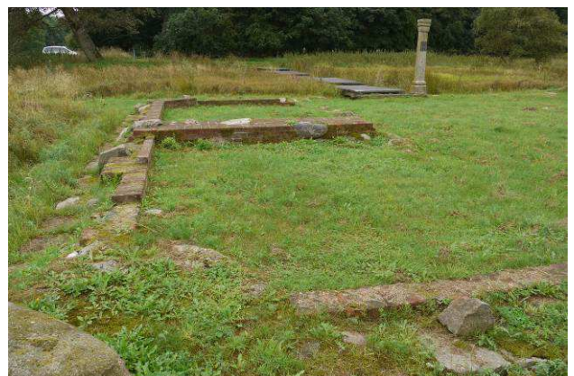
Østlige rum set fra nord