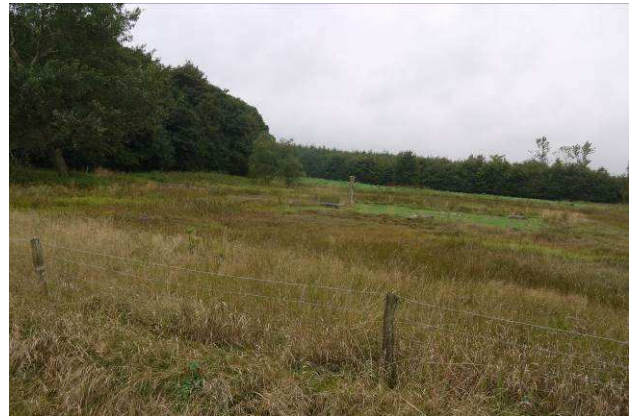
Ruinarealet set fra øst

Adgang fra P-plads til ruinarealet via stente eller låge. Til ruinen via bro med trin i broforløbet.