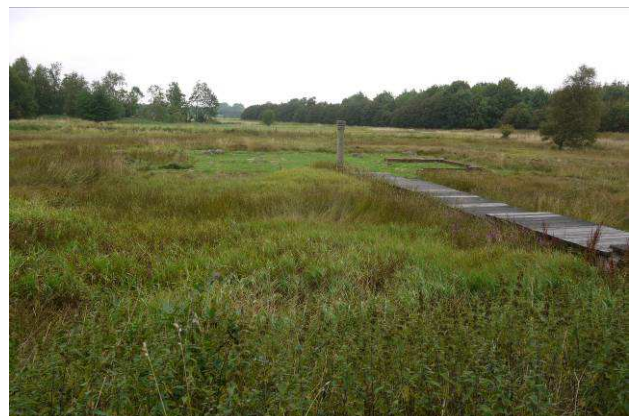
Ruinarealet set fra syd