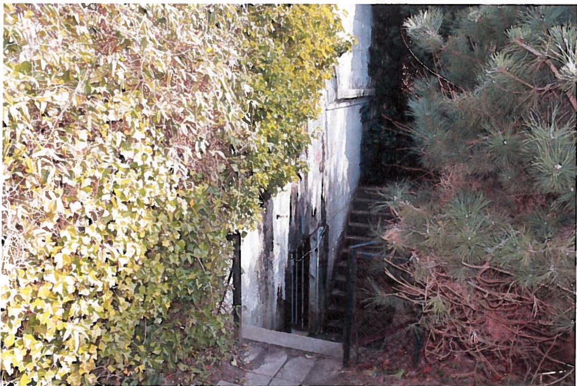
Overblik mod Ø. Ammunitionsmagasinet ligger under løvet .