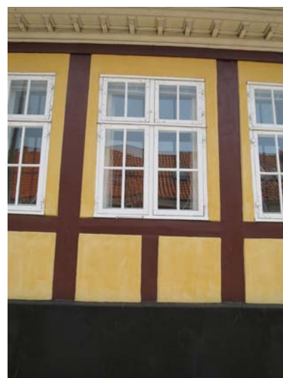
Forhusets bindingsværk og ældre vinduer.

I det indre findes der kulturhistorisk værdi ved den traditionelle planløsning i forhuset med stuer en suite mod gaden og de mere funktionsbetingede rum placeret i sidehusene mod gården. Stuehusets opdeling, rummenes funktion og livet i bygningen afspejles tillige ved den traditionelle materialeholdning og de bevarede bygningsdele. De mest detaljerede interiørs findes hovedsageligt i forhusets stuer, herunder paneler, tofløjede fyldingsdøre og stuk. Hertil kommer de bevarede dele af et ældre køkken og fadebur i den tilbyggede bindingsværkslænge i det nordre sidehus. Indretningen og den enkle materialitet underbygger sammen med det ældre kaldesystem fortællingen om, at dette har været en fornem bolig med et herskab og tilknyttede tjenestefolk.