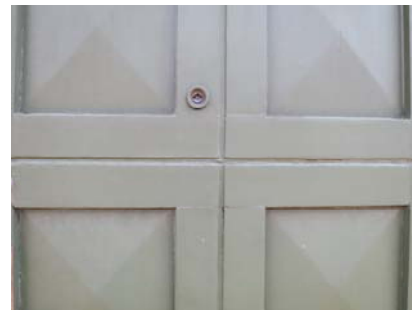
Diamantfyldinger på forhusets port.

I baghuset knytter de bærende fredningsværdier sig til opdelingen med stald og værksted, samt den traditionelle materialeholdning, herunder pigstens- og teglstensgulv, bræddeløfter, bindingsværks- og bræddevægge, revledøre samt de bevarede dele af staldinventaret.