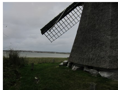
Kig mod Mariager Fjord

Den miljømæssige værdi ved Havnø Vindmølle knytter sig til møllens hævede placering på en bakke, med frit udsyn over Mariager Fjord, som giver en optimal placering for vinden. Ligeledes har møllen stor miljømæssig værdi for det omgivende landskab, idet dens meget karakteristiske silhuet virker særdeles effektiv mod det flade, kultiverede landskab langs fjorden, som domineres af udstrakte landbrugsarealer.