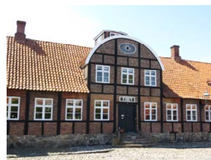
Udsnit af forhuset.

Forhusets kulturhistoriske værdi knytter sig i det indre til de bevarede dele af en ældre planløsning med midterskillevej, forstue og stuer mod gaden, køkken og viktualierum mod gården. Hertil kommer kælderens og den delvist uudnyttede tagetage med adgang til