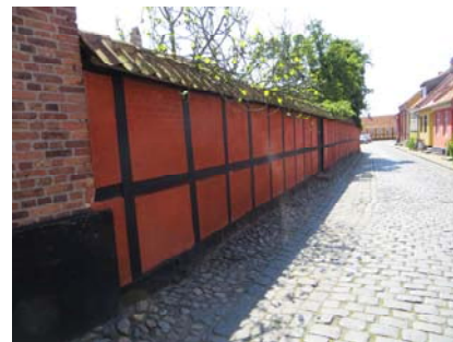
Havemuren (væggaredet) langs Bagergade.

Sidehuset benyttes i dag til opbevaring. Den vestre ende er et stort rum med synlige konstruktioner, bræddeloft, og gulvet er belagt med ældre teglsten og pigsten, der falder mod midten af rummet, hvor der er en brønd. I rummet er der bevaret dele af en stor muret malttørreovn. Den østre halvdel er opdelt i mindre rum, der bærer præg af tidligere indretning til værelser og værksted. Gulvene er belagt med ældre brædder, væggene er af brædder eller murværk, mens loftsbjælker og loftsbrædder er malede. Dørene er ældre revledøre og pladedøre. Endvidere er der et ældre badeværelse og et toilet. Kælderen under sidehuset har pigstensbelægning, synlige konstruktioner, bræddeloft mellem bindbjælkerne og der er kridtmærker på tømmeret og indrids i mørtelen på en muret stolpe. Kælderen mod øst er ligeledes med brolagt gulv og overflader som den vestre, her er dog flere mindre rum samt en ældre ligeløbstrappe til etagen ovenover. Tagetagen er udnyttet, har dels ældre og dels nyere bræddegulv, synlige konstruktioner og skorsten.