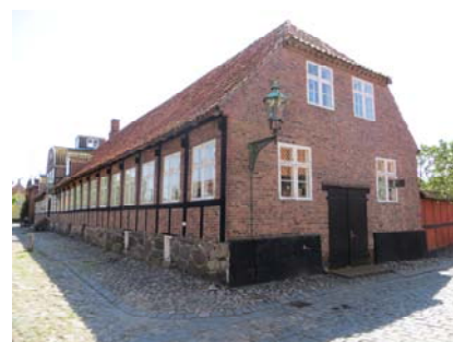
Forhusets nordre gavl.

Forhuset er et 22 fag langt længehus på en sokkel af kampesten. Bygningen er opført i sorttjæret bindingsværk med røde, flammede blankmurstavl mod gaden. Mod gårdspladsen er tavlene pudsede og rødkalkede. Den nordre gavl og den søndre overgavl er grundmuret i røde blanke sten, og nordre gavls sokkel er sortpudset og kvaderfugtet. Taget er et rødt teglhængt tag med halvvalm over nordre gavl, i rygningen er en kikkenborg (udsigtstårn) i sorttjæret bindingsværk med røde blankmurstavl, vinduer i alle fire sider og et svagt buet tag. I rygningen er to skorstenspiber med sokkel og krave og mod gaden to murede, rundbuede kviste med traditionelt udførte, rundbuede, torammede og tredelte vinduer. Omtrent midt på facaden er en trefags, rundbuet frontgavl. På havesiden er en femfags lude (også kaldet en hodda ), og foran denne er en nyere træterrasse med trappe. Under frontgavlen er en ældre tofløjet fyldingsdør med en stor, svungen sandstenstrappe foran. Over døren er et spejlmonogram og årstal. Øverst i frontgavlen er et ældre ovalt støbejernsvindue med mønsteropsprokning. I den nordre gavl er en tofløjet revleport til en kælder, og i havesiden er revledøre med granittrapper foran og en terrassedør. Vinduerne er ældre, hvidmalede korspostvinduer med todelte underrammer, og i søklen mod nord er traditionelt udførte kældervinduer.