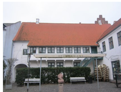
Gårdsiden af Nørregade 22.