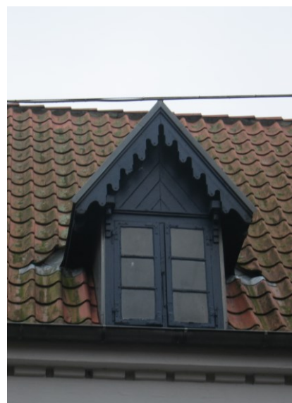
En kvist i gadesidens tagflade.