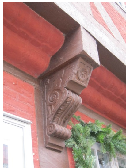
Stokværksfremspringet med en af de udskårne knægte samt buede formsten.

Gårdsiden er ligeledes opført i bindingsværk, der er anvendt højstolper, gennemstukne bjælketappe og dobbelte skråstivere flere steder i overetagens undertavl samt en dok i de øverste tav. Tømmer og tav er gulkalket over stok og sten. Der er en diamantflammeret dør midtfor. Vinduerne er som på gadesiden. Over de nordligste fag er det tilbygget en 31 fag lang sidelænge opført i bindingsværk med fremspringende bjælker, der støttes af knægte, hvoraf de vestligste er konsolformede og de øvrige med kølbueformede affasninger. Længen bærer et teglhængt heltag med to skorstenspiber og en kvist. Vinduerne er ældre torammede og opsprossede, der er tillige en flammeret dør samt en tofløjet port i sidelængen. Både portfløje, døre