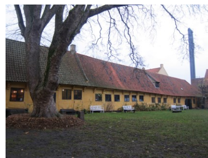
Sidelængen set fra gården.

Sidelængen er ligeledes indrettet til udstillingslokaler med gårdinteriører med traditionelle overflader, plankegulve, bræddeloft med synlige bjælker med kopbånd, revledøre med ældre beslagværk samt pudsede og kalkede vægge. Farveholdningen er ligeledes traditionel: en farvestrålende almuepalet, der harmonerer med det udstillede inventar. Særudstillingsrummene er præget af nyere overflader og belysning, de er møbleret med montrere og plancher. Den østlige ende af længen er gennemskåret af et pigstensbelagt portrum, og de sidste rum i længen anvendes til skolepisestue med tilhørende køkkenfaciliteter. Den vestlige del af loftetagen bruges til opbevaring, hvor rummet har nyere overflader. Den øvrige del af loftet fremstår uudnyttet.