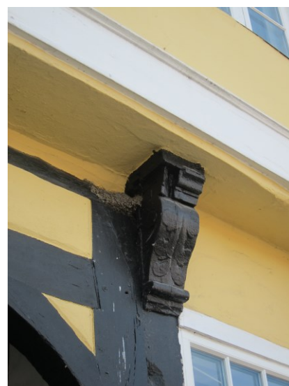
En af facadens udskårne knægte med arkantusblad.

Den arkitektoniske værdi ved Torvet 13 knytter sig i det ydre til facaden mod Torvet, der med sit sine udskårne knægte og den klassicistiske overfacade danner en levende og dynamisk sammensætning i den lille og taktfast inddelte facade. I kontrast til den sammensatte og let dekorerede facade står portrummet og sidehusets kraftige, uudsmykkede bindingsværk, hvor det enkle og solide udtryk tydeligt signalerer bygningens funktionsbetingede fortid.