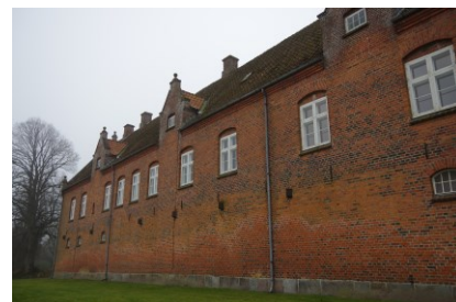
Grev Knuths Hus set fra øst.

Paradedrivhuset står i mur, jern og glas, og det er 43 meter langt, og det består mod syd af to gange ti fag samt herimellem en forhøjet