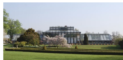
Paradedrivhuset set fra syd.

midterdel i tolv fag – alt sammen over en muret sokkel. Drivhuset er opført som jernkonstruktion med glaspartier imellem, og indgangsdøren sidder i drivhusets midte. Mod nord er drivhuset grundmuret, ligesom gavlene er det. Drivhusets centrale del er dekoreret med palmetter og kronet af en lanterne.