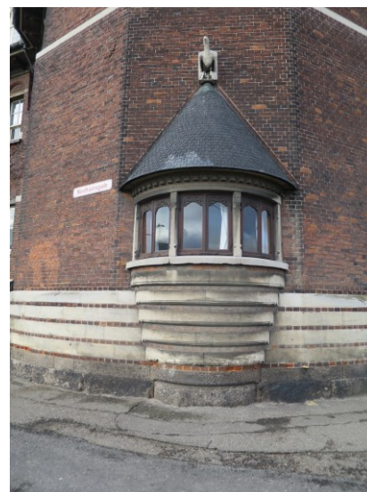
En af de to små karnapper på de ottekantede tårne.

Hertil kommer den brede trappe mellem de to hjørnetårne, der er med til at iscenesætte en formel ankomst til bygningen, mens det lukkede gårdrum har en mere anonym fremtræden og afspejler en mere praktisk anvendelse.