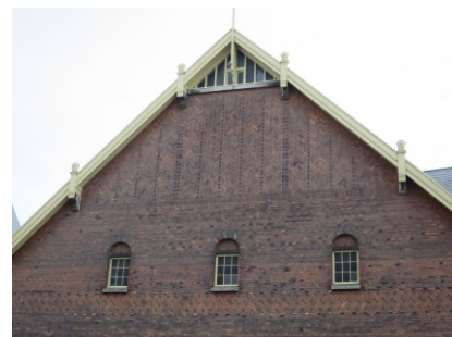
Eksempel på mønstermuring og detaljeret vindskede i pakhusesets gavle.

I toldkammerbygningens indre knytter den kulturhistoriske værdi sig til den videre fortælling om bygningens oprindelige funktion. Dette ses af den ældre grundplan med blandt andet stueetagens