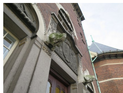
Indgangspartiet med sandstensblændinger og hundehoveder.