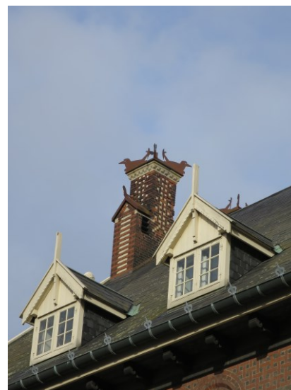
To af de små kviste med husbrande og en af skostenspiberne med mønstermuring og afslutning med fugle.

offentlige og repræsentative forhal, det store rum, som tidligere fungerede som vejerbod, og de oprindelige kontorer til regnskabsfolk og toldere. I de to hjørnetårne findes de fornemmeste kontorer oprindeligt til brug for havneopsynsmanden og toldinspektøren. Udsmykningerne i loftet henviser til bygningens nære kontakt til havet i form af de maritime motiver. Ydermere er strukturen på førstesalen bevaret med tjenestelejligheden samt den lange gang med nummererede, brede døre, som vidner om det oprindelige frilager, og på traditionel vis er bygningen forsynet med sekundære trapper med en sliske samt kælderrum og uudnyttede tagrum til opbevaring. Ydermere er det oprindelige urværk bevaret øverst i tårnet. I pakhuset påviser både de store, åbne pakhuslofter, den kraftige konstruktion med søjler, drager, bjælker og kopbånd samt de ældre elevatorer, at denne bygning har fungeret som lagerbygning.