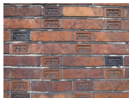
Eksempel på murværkets specialfremstillede "ATA-sten".

I det indre knytter den arkitektoniske værdi sig til den centrale forhal med høje paneler og kraftige dørindfatninger, der hænger naturligt sammen med den tragtformede hovedtrappe. Foruden forhallen fremtræder stueetagens kontorer i de ottekantede tårne som de mest dekorerede rum med både udsmykning af vægge og lofter. I hele bygningen gælder det, at de højloftede rum fremtræder