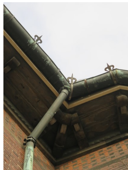
Gesimsen i træ samt kobber nedløbsrør og tagrender.