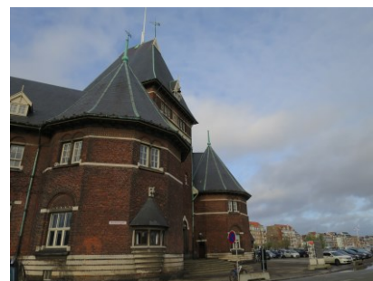
Sammenstillingen af midtertårnet og de to ottekantede hjørnetårne.

I midtertårnet findes et markant indgangsparti. Døren heri er en ældre, tofløjet, massiv teaktræsør med bronzegreb og opdelt overvindue. Døren indrammes af granitindfatninger, ligesom de to vinduer på hver side af denne. Døren krones af en sandstenstavle, og herover ses et parti med tre små vinduer. Alle vinduer i