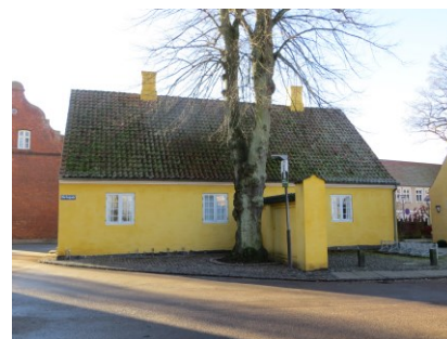
Faaborg Hospital, set fra Klerkegade.

Faaborg Hospital ligger med gavlen vendt mod Helligåndskirken, men er i øvrigt en fritliggende bygning med Hospitalsstræde langs den ene side og Klerkegade langs den anden. Et lille stykke mur med murpille på Kirkestræde løber an på huset, som har et mindre gårdrum op mod gavlen modsat kirken. Der ligger yderligere en bygning på grunden, men kun forhuset er fredet. Bygningen anvendes i dag til administrative formål i forbindelse med kirken.