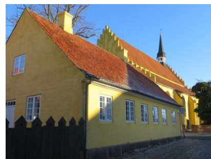
Faaborg Hospital, set fra Hospitalsstræde med det særegne stakit.

Det er også af arkitektonisk værdi, at bygningen kan henføres til den fine klassicistiske tradition, som udviklede sig i Faaborg i slutningen af 1700-tallet og i første halvdel af 1800-tallet. Klassicismen har efterladt sig andre fornemme monumenter i Faaborg, f.eks. skolen på Østergade. Mændene, der skabte denne tradition, synes at være udgået af bygmesterdynastiet Lang. Der har virket ikke mindre end