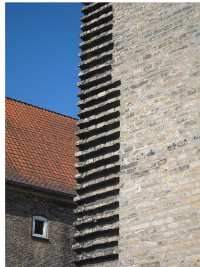
Det riflede murværk på Skindpakhuset sydøstlige gavl.