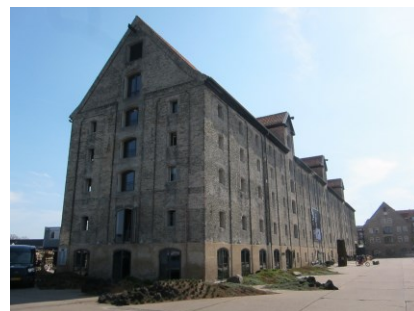
Det store pakhus.

Det store pakhus er en grundmuret bygning opført i 23 fag og i fem etager. Over en lav granitsokkel er muren ved den nederste etage pudset i en lys sandfarve, mens den resterende del af murværket står i blank, gul mur og afsluttes af en profileret hovedgesims i træ. Pakhuset har et heltag med røde vingetegl. I taget ses tre hejsekviste i hver tagflade. Hejsekvistene har teglhængte heltage, gesims og hejsebom øverst. I hejsekvistene og på etagerne herunder samt i hver gavl er brede pakhusåbninger med fladbuede stik og pudsede lysninger. I åbningerne sidder nyere glasdøre med aluminiumsrammer, der er placeret dybt i muren. Den nederste etage har tillige mange fladbuede døråbninger, hvor nyere glasdøre er placeret næsten i plan med muren. De øvrige åbninger i pakhuset er mindre, stadig med fladbuede stik og med etrammede vinduer med aluminiumsrammer og termoruder placeret dybt i muren. Alle åbninger er taktfast placeret, og alle fag er indrammet af ørelisener med undtagelse af hejsekvistfagene, der har blændinger, som fortsætter op i hejsekvistenes trekantgavle og afsluttes med en rundbue. I bygningens gavle er tillige ørelisener og blændingsfelt i det midterste fag og i hele gavltrekanter. Øverst i gavlene ses tillige hejsebomme. I de to yderste fag længst mod syd er en stor gennemgående, toetagers åbning, hvori der er indsat et nyere glasparti.