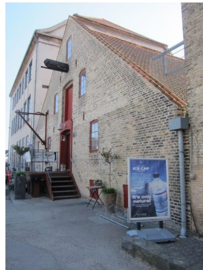
Det brede pakhus. Den nordvestlige gavl.

I det indre er indrettet butik i stueetagen og lager i tagetagen. Pakhuset har i store træk bevaret den oprindelige åbne struktur med et stort gennemlyst rum og synlig tømmerkonstruktion. Der er ældre bræddegulve og bræddeløfter samt pudsede og malede ydervægge. I et nyere vindfang ved den nordvestlige gavl findes en ældre ligeløbstrappe i træ til tagetagen. Enkelte steder er nyere skillevægge og store frysebokse installeret. Under bygningen er en muret kælder, der anvendes til opbevaring.