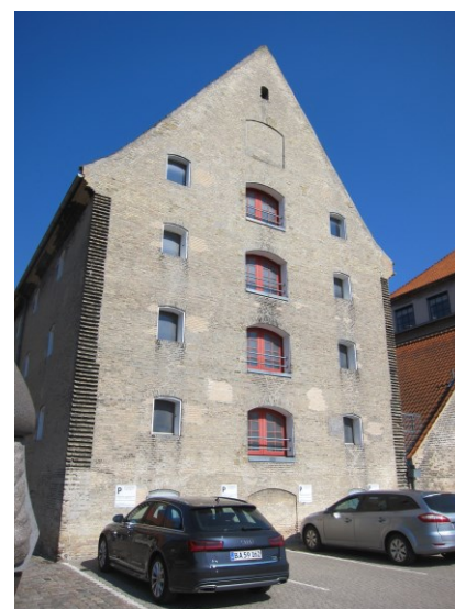
Skindpakhuset. Den Sydøstlige gavl.

Skindpakhuset er i det indre velbevaret med åbne planer på alle etager og synlig tømmerkonstruktion. Der er ældre bræddegulve og pudsede ydervægge, mens lofterne består af nyere plader, der er monteret mellem det synlige bjælkelag. To nye trappekerner er etableret i pakhuset, hvor nye ståltrapper giver adgang til alle etager. Internt på hver etage er tillige ældre ligeløbstrapper i træ