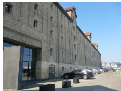
Det store pakhuis yderst på kajen.

I 1763 manglede man et større pakhuis til opmagasinering af varer fra Island, Færøerne og Finmarken. Det nye pakhuis blev opført under ledelse af arkitekten J.C.Conradi. Conradi havde omkring 1750 ledet opførelsen af Eigtveds Pakhus i Strandgade og i 1760 det nærliggende Wilders Pakhus. I 1767 blev tagets tømmerkonstruktion rejst og bygningsarbejdet endeligt afsluttet senere på året.