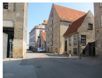
Strandgade med pakhuse placeret på begge sider, og i naturlig sammenhæng med øvrige bygninger, der i store træk har samme materialeholdning.