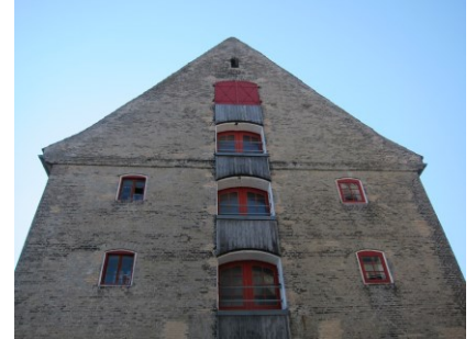
Skindpakhusets nordvestlige gavl med brædebeklædningen mellem de store pakhusåbninger.

Den arkitektoniske værdi knytter sig overordnet til alle tre bygningers sluttede og enkle form med murflader i blanke, gule sten og store næsten ubrudte tagflader. Pakhusene fremtræder med en balance mellem taktfasthed, proportionering, rene linjer og det konstruktivt mulige. Alle tre bygninger har en velproportioneret