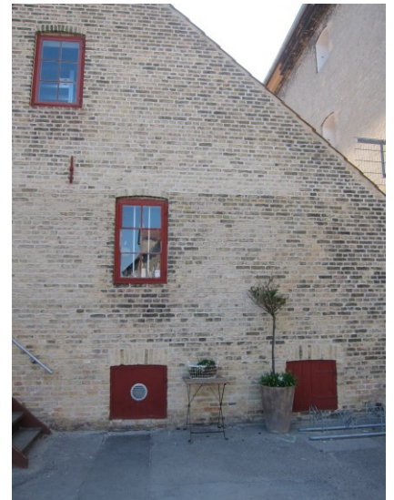
Det brede pakhhus.