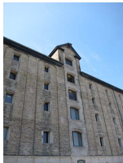
Det store pakhuis med en af hejsekvistene. Her ses de forskellige muredetaljer.

I det ydre knytter de bærende fredningsværdier sig til de tre pakhuses volumener, og den håndværkmæssige kvalitet hvormed de er opført. Hertil kommer værdien af lighederne og forskellene mellem bygningerne, der afspejler deres oprindelige anvendelse, så som murværket med alle detaljer, herunder ørelisener, blændingsfelter, indfatninger og lysninger samt de store teglhængte og næsten ubrudte heltage med hejsekviste på Det store pakhuis. Ydermere gælder det alle pakhuisåbninger, de ældre vinduer, bræddebeklædningen på Skindpakhuisets gavle samt de bevarede