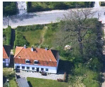
Egehuset med det store egetræ i haven.

For Egehuset er den arkitektoniske værdi knyttet til bygningens klart aflæselige og sluttede hovedform, med den taktfaste facadeopbygning mod vejen, og det teglhængte valmtag med ubrudt tagflade. Dette giver bygningen et roligt og værdigt udtryk, som på trods af at være resultat af en senere ombygning, ikke svækker bygningens arkitektoniske værdi. Aflæsningen af den tidligere funktion som skole er dog svækket herved, i kraft af den forsvundne skolestue samt udgangen til haven fra samme.