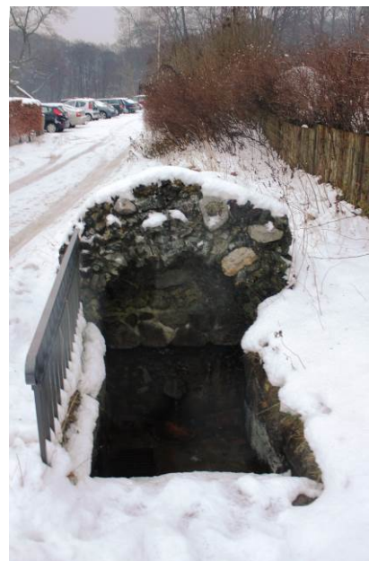
Den fredede kilde

I bygningens indre er de bærende fredningsværdier knyttet til den delvist bevarede planløsning med langsgående bærende skillevæg, skorstenene, de kurvehanksbuede vindueslysninger, de ældre døre samt trapperne i trappeopgangene inklusive loftstrappen. Hertil kommer den traditionelle materialeholdning.