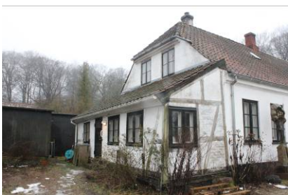
Bindingsværksslude på østgavl.