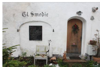
Indgangsparti på vestgavlen.

I det indre er bygningen opdelt i to lejligheder, den ene med adgang fra nordsiden og bindingsværkssluden, og den anden fra den vestlige gavl. Tagrummet er udnyttet til beboelse. Bygningens interiør er generelt præget af nyere overflader og materialer. Enkelte ældre døre er bevaret, men forsynet med nyere hængsler og gerigter. Planløsningen bærer fortsat præg af mindre rum. Stuen i den ene lejlighed er som det eneste rum gennemlyst fra begge sider. I samme lejlighed er installeret en nyere trappe.