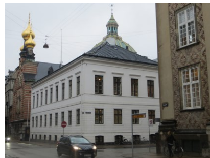
Hansens Palæ ligger på hjørnet i Frederiksstad ved siden af den Russiske kirke og Frederikskirken i baggrunden.

De bærende fredningsværdier knytter sig i det indre til de bevarede dele af den traditionelle grundplan med hovedtrapperum, køkken i kælderen og stuer på førstesalen. Desuden alle de bevarede bygningsdele og -detaljer, herunder vinduer med anverfere og stormkroge, parketgulve, hovedtrapperummet med alle detaljer, herunder fodpanel, balustre, håndliste, mægler samt det pudsede løb og stuk, de ældre dele af de to enkle trapper, de en- og tofløjede fyldingsdøre med alle detaljer, den enkle loftstrappe, paneler,