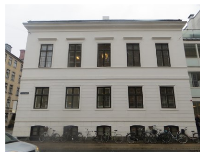
Gavlen mod Fredericiagade.

I det indre er Hansens Palæ indrettet til erhvervsformål. Kælderen fremstår med nyere interiør, herunder pudsede vægge og lofter, støbt eller flisegulv, glatte døre samt enkelte termoruder. Dog ses en ældre fyldingsdør med ældre gangtøj samt ildstedskappen. En nyere trappe forbinder kælderen med stueetagen, der overvejende fremstår som et åbent rum med enkelte mindre kontorer, der er adskilt af nyere