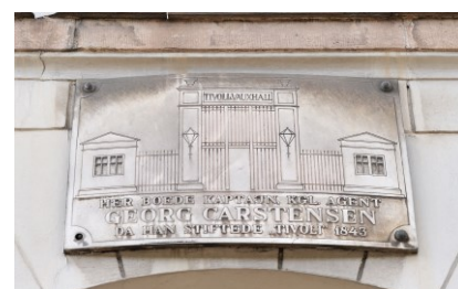
Mindeplatte over porten afbildende Tivolis første hovedindgang til minde om Georg Carstensen der skabte Tivoli, som boede på adressen.

Peter Faber (1810-1877) boede ligeledes på Gammel Strand 40 i 1850-1853. Faber var inspektør ved den Polytekniske Læreanstalt og senere direktør for Danmarks første telegrafjeneste. Mest kendt er han dog nok for sine sangtekster der inkluderer Højt for træets