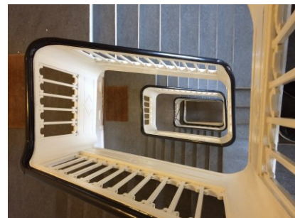
Durchsicht i trapperum, Gammel Strand 40

Læderstræde 9 er en grundmuret bygning der står på en granitsokkel. Bygningen er opført i fire etager over en høj kælder og indrettet tagetage. Bygningen er syv fag bred og bærer et rødt teglhængt heltag. I tagfladen er der på hver side af tagryggen fire nyere tagvinduer.