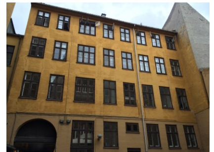
Gårdside, Læderstræde 9

De mange oprindelige og ældre bygningsdele og –detaljer har ligeledes stor kulturhistorisk værdi, idet de vidner om periodens udsmykningsideal og æstetiske præferencer. Af særlig værdi har lærredsvæggene i repræsentationsstuerne i Gammel Strand 40 samt for begge bygninger, de to oprindelige trapper med alle detaljer, herunder de dekorerede vanger og udsmykkede balustre.