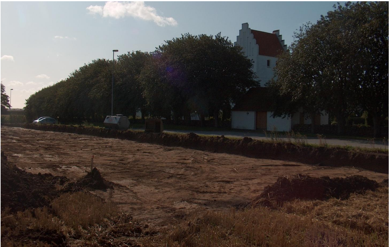
Udgravningsfeltet set fra nordvest.

På ældre kortmateriale fra slutningen af 1800 tallet ses kirken at ligge uden en omkringliggende bebyggelse, idet landsbyen (dengang kaldet Rorup) ses at ligge længere mod syd. Muligvis er der her tale om en kirke med en tæt tilknytning til en tidligmiddelalderlig gård (som det kendes ud fra arkæologiske undersøgelser ved f. eks. Tamdrup og Lisbjerg kirker), eller der kan være sket en flytning af landsbyen fra en placering umiddelbart ved kirken til den nuværende sydligere placering. Den stående kirke menes at være opført i første halvdel af 1200 årene. Rent topografisk er området nord for kirken meget velegnet for placeringen af en bebyggelse, idet der her er tale om et lidt højtliggende, ret jævnt plateau, mens det syd for kirken er noget mere kuperet.