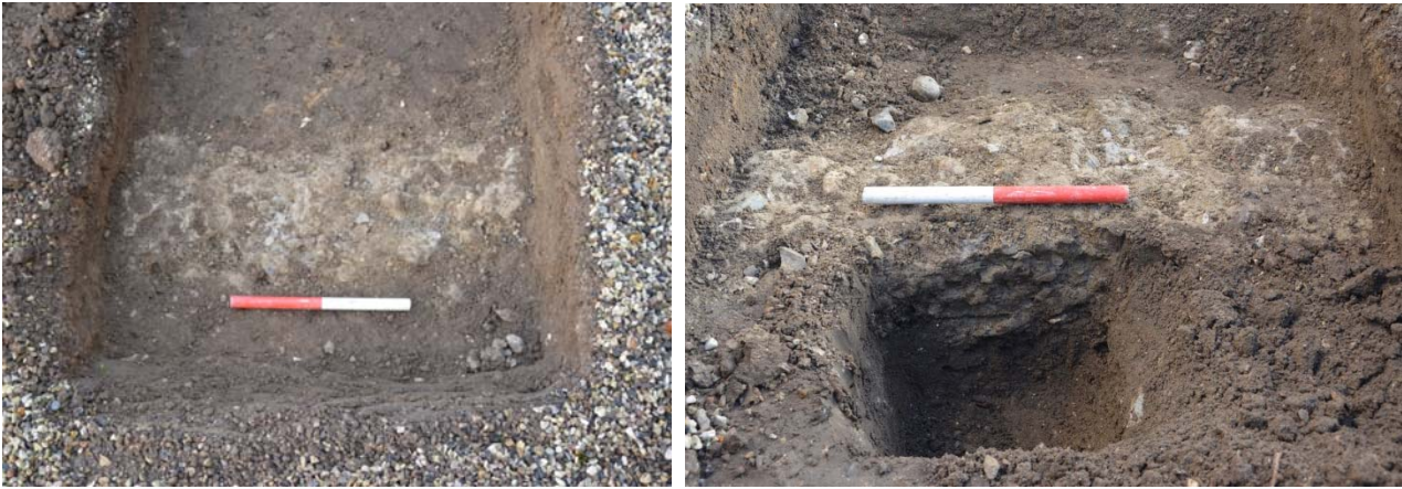
Til venstre ses fundamentet i fladen (set fra øst). Til højre ses fundamentet i snit (set fra vest).

Det vides ikke, hvad fundamentet har været brugt til. Der kan være tale om fundamentet til en sidebygning, et trappetårn eller måske resterne af en kassemur fra middelalderen, hvor de to murskaller er fjernet. Der står ikke noget i J.P. Traps Danmark om bygninger mellem tårn og våbenhus, men kirken har gennemgået flere gennemgribende ombygninger.