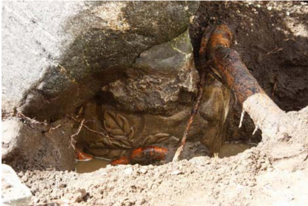
Runestenens opklodsning, bemærk den reliefhuggede gravsten med bladornamentik.