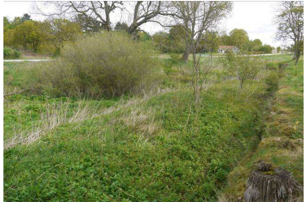
Nordre grav set mod øst