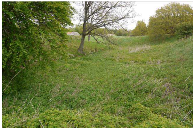
Søndre grav set mod øst