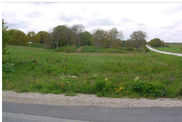
Skovgårde set mod vest

Adgang fra P-plads af fortidsmindet, i alt ca. 110 meter.