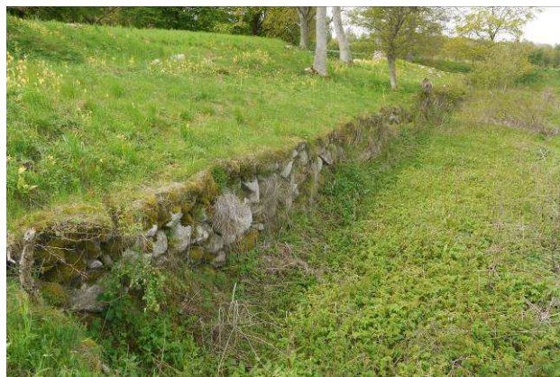
Borgbankens nordside set mod vest