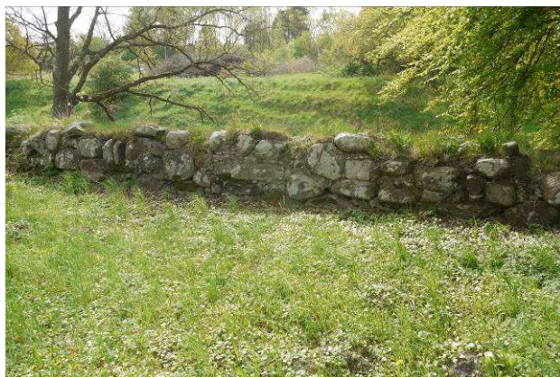
Sydfløjens inderside af sydmuren