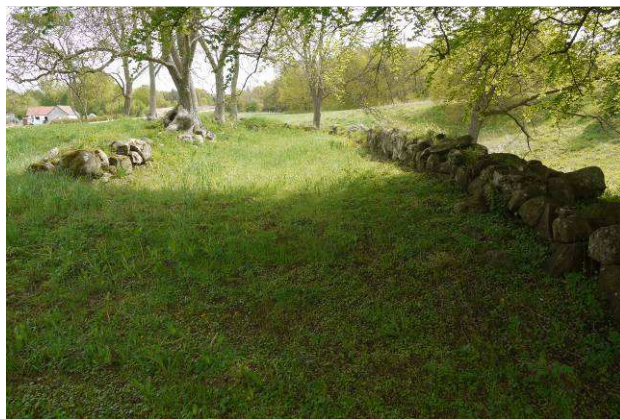
Sydfløjen set mod øst