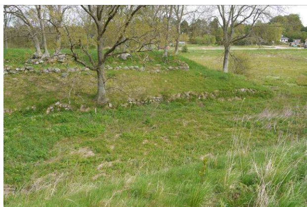
Borgbankens sydøstre del