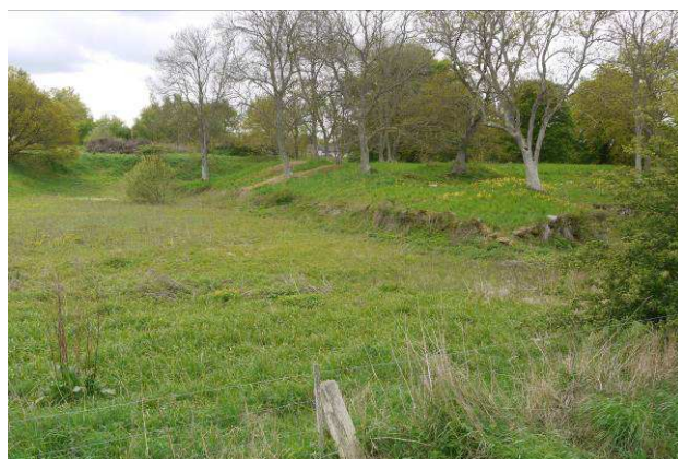
Borgbankens østside med grav set mod syd