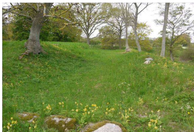
Nordfløjen set mod vest

Ny gangbro 400.000 Oprensning af grav (3800 m 2 ) 750.000 Fjernelse af opfyldning i graven 100.000 Opmåling/arkæologiske undersøgelser 400.000