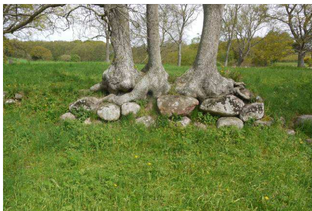
Overgroet murparti af sydfløjens nordmur