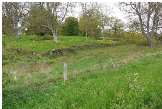
Ensidig fremspringende hjørnebastion mod nordøst