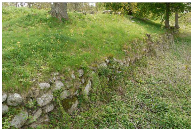
Borgbankens vestside set mod syd