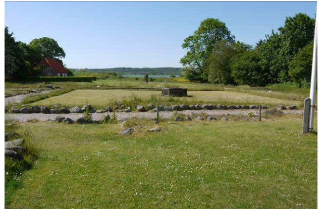
Klostergården med Mossø i baggrunden