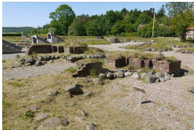
Klosterkirken set mod sydvest