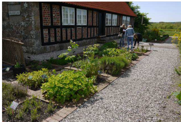
Museumshus og klosterhaven