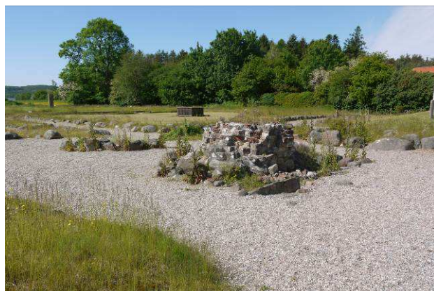
Bevaret pille i klosterkirken set fra nordøst