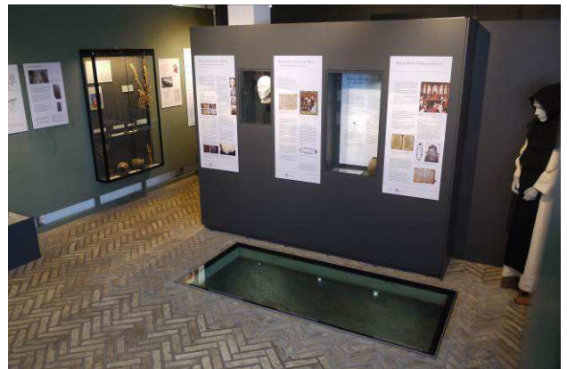
Udstilling i museumshuset