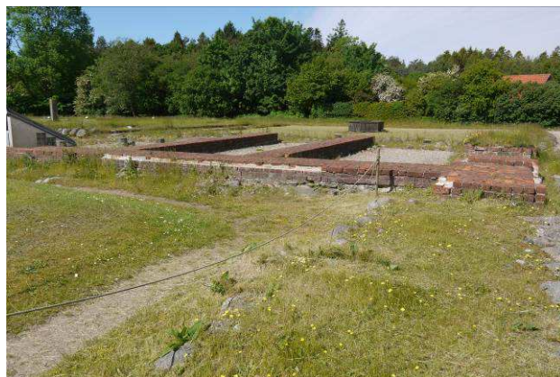
Østfløjens set fra øst