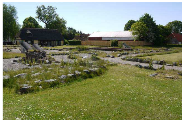
Klosterkirken og østfløjen set mod sydøst