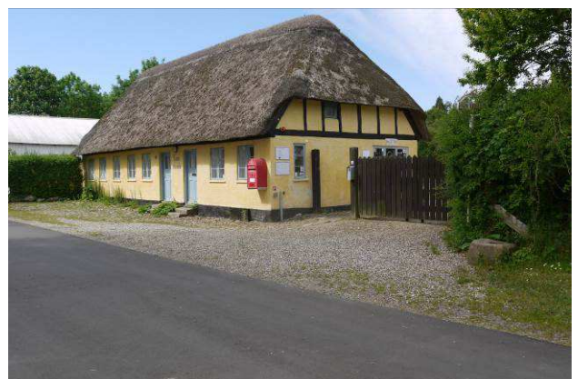
Indgang til Øm Kloster